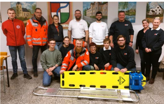
Ausrüstung für die Patientenversorgung – neues Spineboard und neue Schaufeltrage für den Ortsverein.

Ein besonderer Dank gilt der Gemeinde Oberwiera. Sie stellt uns nicht nur einen Schulungsraum und Sanitäreinrichtungen zur Verfügung – eine unverzichtbare Grundlage für unsere Ausbildungsabende und Treffen – sondern hat uns zudem eine neue Vakuummatratze sowie einen Pavillon gespendet. Gerade die Vakuummatratze ist ein wichtiges Rettungsmittel, um verletzte Personen schonend und sicher zu versorgen. Der Pavillon bietet uns bei Sanitätsdiensten Schutz für Helfer und Patienten. Diese Unterstützung erhöht unmittelbar die Qualität unserer Hilfeleistung.