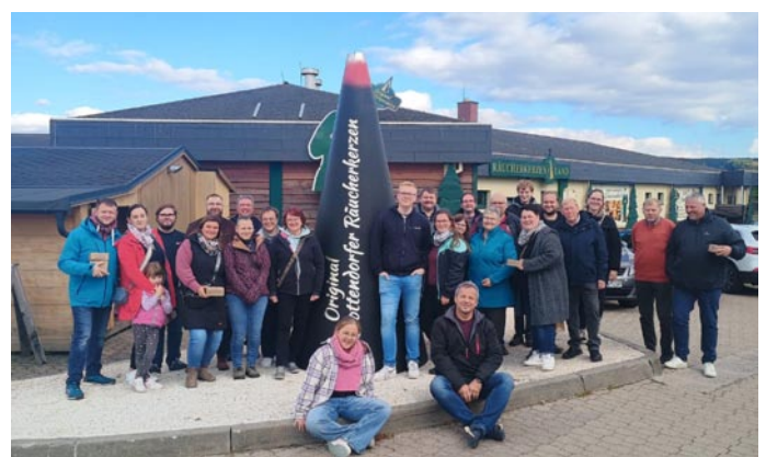
Begegnung mit dem Partnerverein – Austausch und Kameradschaft über Regionen hinweg.