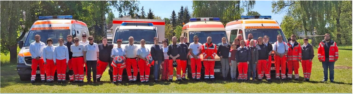
Gemeinsame Einsatzbereitschaft im Katastrophenschutz – Helferinnen und Helfer vor den Einsatzfahrzeugen.

DRK-Ortsverein Oberwiera/Waldenburg sagt Danke für starke Unterstützung