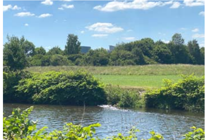
Bild 4: ... das dann in die Zwickauer Mulde und damit in die Natur geleitet wird

Das Einleitgewässer, Vorfluter genannt, ist die Zwickauer Mulde (Bild 4).