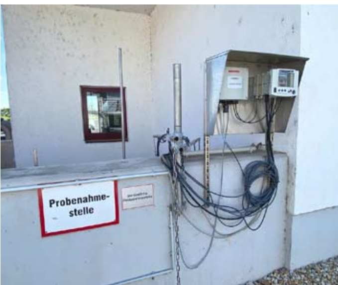
Bild 3: Probenentnahmestation für die finale Kontrolle des Wassers, ...

Der Kläranlagenablauf erfolgt im Freispiegel (ohne Pumpen) und passiert auf diesem Wege noch eine Probenahmestelle (Bild 3), an welcher automatisch alle 24 Stunden Mischproben entnommen werden und über verschiedene Sonden Ablaufparameter wie Nitrat, Ammonium, Nitrit und der CSB erfasst und ins Leitsystem zur Überwachung und eventuellen Störmeldung übertragen werden.